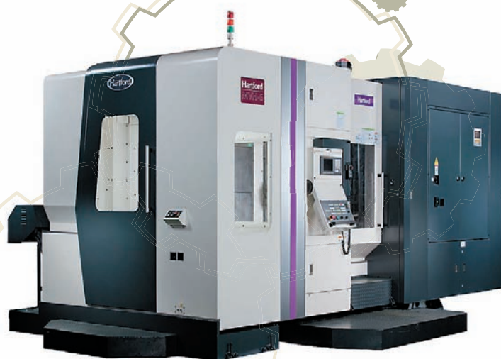
↑ Горизонтальный обрабатывающий центр Hartford Серии Laurel, модель MVH-6

Hartford, а лишь те, которые лучше всего отвечают требованиям заказчика. Также представители компании неоднократно посещали предприятия Hartford и могли наглядно убедиться, насколько высока культура производства и на каком уровне делаются станки. В частности, станины Hartford лют из специального материала MEEHANITE.