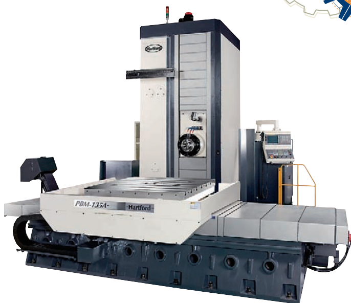
↑ Фрезерный станок Hartford серии PBM, модель BPM-135A