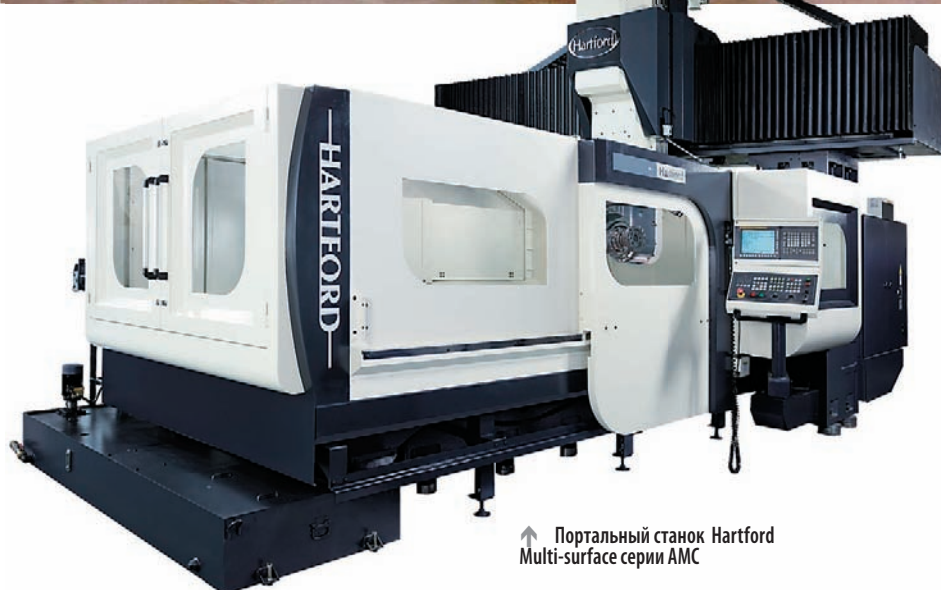
↑ Портальный станок Hartford Multi-surface серии AMC