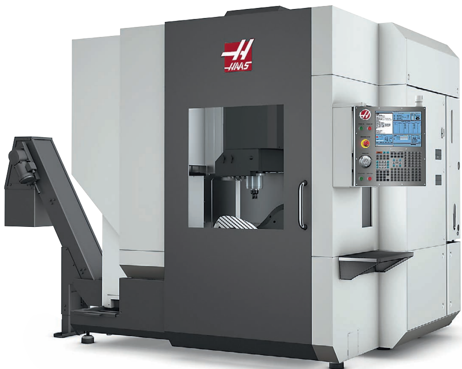
↑ 5-осевой вертикальный обрабатывающий центр UMC-750

Конструкция стола позволяет устанавливать детали практически под любым углом для 5-сторонней (3+2) обработки. Кинематика станка предполагает одновременное движение по 5 осям для контурной или