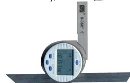
Фото 3. Угломер, тип 3э