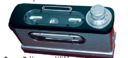
Фото 7. Уровень УБМ