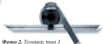
Фото 2. Угломер, тип 3э