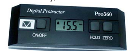
Фото 4. Угломер 360Ц