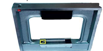
Фото 6. Уровень УР