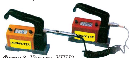
Фото 8. Уровень УПЦ2