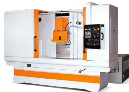
☞ Плоскошлифовальный станок модели ОШ-4080

Ограждение рабочей зоны — кабинетного типа — с раздвижными дверями.