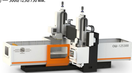
☞ Станок портальный плоскошлифовальный с ЧПУ модели ОШ-125300

Класс точности — В, мощность главного привода — 15 кВт, габариты стола — 1250 × 3000 мм, максимальные размеры заготовки (длина/ширина/высота) — 3000/1250/750 мм.