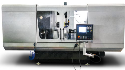
☞ Специальный плоско-шлифовальный станок с ЧПУ модели ОШ-665Ф3

Мощность электрошпинделя — 7,5 кВт, частота вращения внутришлифовального шпинделя — 5 000...45 000 об/мин. Точность поворота делительного стола — 2,5 сек.