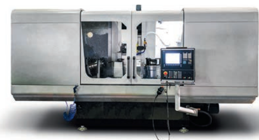
☞ Специальный плоско-шлифовальный станок с ЧПУ модели ОШ-665Ф3

Мощность электрошпинделя — 7,5 кВт, частота вращения внутришлифовального шпинделя — 5 000...45 000 об/мин. Точность поворота делительного стола — 2,5 сек.