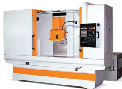
☞ Плоскошлифовальный станок модели ОШ-4080

Ограждение рабочей зоны — кабинетного типа — с раздвижными дверями.